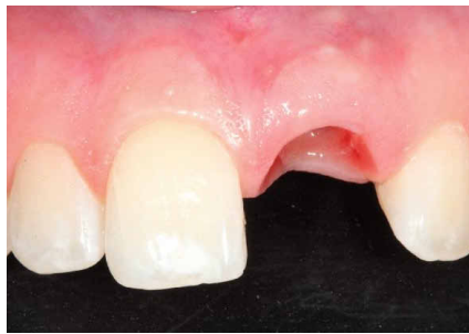
Situation nach Extraktion am Tag der Sofortimplantation