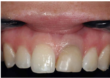
Situation vor Implantation